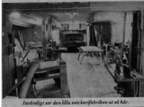
Invändigt ser den lilla snickerifabriken ut så här.