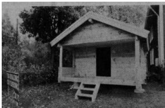
En gäststuga är först på plan vad stugbyggandet beträffar. Den här kommer att flyttas till Dalarna vad det lider.